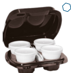
ICAN91 KAFFEBOX CONTENITORE+COPERCHIO PORTA 4 CAFFÈ pz/conf pcs/pack 60 pz/cart pcs/box 360