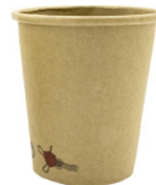
1BG632 BICCHIERI HOT DRINK BC35 capacità capacità 350cc / 10oz pz/conf pcs/pack 50 pz/cart pcs/box 1000