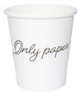
1BG301 BICCHIERI CAFFÈ BOP05 capacità capacity 80cc / 3oz pz/conf pcs/pack 100 pz/cart pcs/box 2000