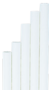
1CAN74 CANNUCCE DRITTE CARTA BIANCA dimensioni size h 150mm / Ø 7mm pz/conf pcs/pack 250 pz/cart pcs/box 7000