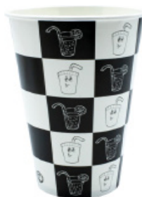
1BG029 BICCHIERI B42 SCACCHIERA capacità capacity 420cc / 12oz tacca filling line 0,35 pz/conf pcs/ pack 100 pz/cart pcs/box 2000