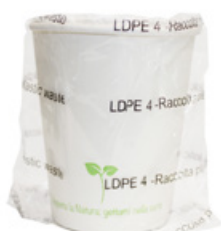
1BG802 BICCHIERI CARTA BH25 IMBUSTATI SINGOLARMENTE capacità capacity 250cc / 8oz pz/cart pcs/box 600