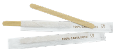
GW2912P PALETTE CAFFÈ LEGNO INCARTATE SINGOLARMENTE dimensioni size h 11cm pz/conf pcs/pack 1000 pz/cart pcs/box 10000