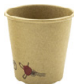
1BG017 BICCHIERI CAFFÈ BC10 capacità capacità 120cc / 4oz pz/conf pcs/pack 50 pz/cart pcs/box 2000