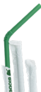
1CAN64 CANNUCCE PIEG. PLA BIO-ECO INCARTATE dimensioni size h 240mm / Ø 5mm pz/conf pcs/pack 400 pz/cart pcs/box 6400