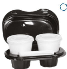
ICAN92 KAPPUCCIOBOX CONTENITORE+COPERCHIO PORTA 2 CAPPUCCINI pz/conf pcs/pack 50 pz/cart pcs/box 400