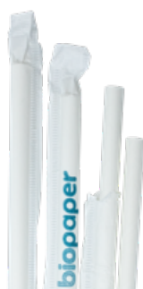
1CAN72 CANNUCCE DRITTE CARTA INCARTATE dimensioni size h 200mm / Ø 6mm pz/conf pcs/pack 150 pz/cart pcs/box 4500