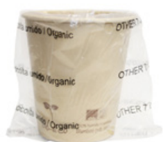
1BG810 BICCHIERI CARTA COMPOSTABILE BH20 IMBUSTATI SINGOLARMENTE capacità capacity 200cc / 7oz pz/cart pcs/box 600