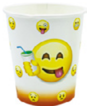
1BG019 BICCHIERI B20 ORANGE capacità capacity 200cc / 7oz tacca filling line 0,15 pz/conf pcs/pack 100 pz/cart pcs/box 2000