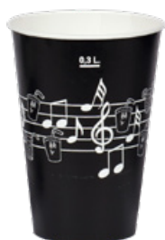
1BG023 BICCHIERI B37 PENTAGRAMMA NERO capacità capacity 370cc tacca filling line 0,30 pz/conf pcs/ pack 100 pz/cart pcs/box 2000