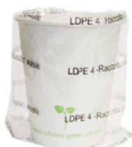
1BG800 BICCHIERI CARTA BH20 IMBUSTATI SINGOLARMENTE capacità capacity 200cc / 7oz pz/cart pcs/box 600