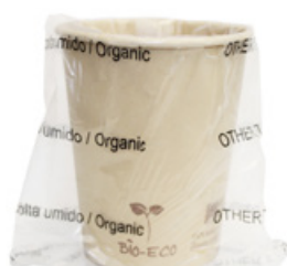
1BG812 BICCHIERI CARTA COMPOSTABILE BH25 IMBUSTATI SINGOLARMENTE capacità capacity 250cc / 8oz pz/cart pcs/box 600