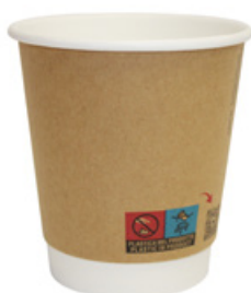
1BG222 DOUBLE WALL BW35 colori colors NERO / AVANA capacità capacity 350cc / 10oz pz/conf pcs/pack 25 pz/cart pcs/box 500