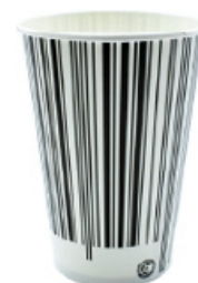
1BG022 BICCHIERI B30 CODICE BARCODE capacità capacity 300cc tacca filling line 0,25 pz/conf pcs/ pack 100 pz/cart pcs/box 2000