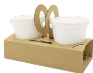
1SP101 CAPPUCCIO SPEED pz/conf pcs/pack 100 pz/cart pcs/box 600