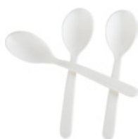
TVP226 CUCCHIAINI PLA BIO-ECO dimensioni size h 10,5cm pz/conf pcs/pack 100 pz/cart pcs/box 2000