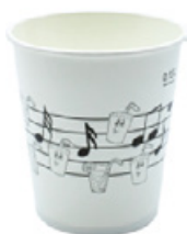
1BG019 BICCHIERI B20 PENTAGRAMMA BIANCO capacità capacity 200cc / 7oz tacca filling line 0,15 pz/conf pcs/ pack 100 pz/cart pcs/box 2000