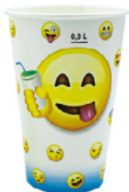
1BG023 BICCHIERI B37 BLUE capacità capacity 370cc tacca filling line 0,30 pz/conf pcs/pack 100 pz/cart pcs/box 2000