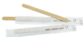
GW2913P PALETTE CAFFÈ LEGNO INCARTATE SINGOLARMENTE dimensioni size h 9cm pz/conf pcs/pack 1000 pz/cart pcs/box 10000