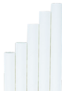
1CAN77 CANNUCCE DRITTE CARTA BIANCA dimensioni size h 200mm / Ø 8mm pz/conf pcs/pack 150 pz/cart pcs/box 3150