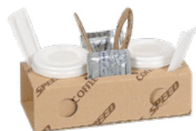
1SP100 COFFEE SPEED pz/conf pcs/pack 100 pz/cart pcs/box 600