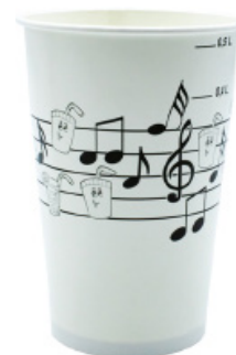
1BG030 BICCHIERI B55 PENTAGRAMMA BIANCO capacità capacity 550cc / 16oz tacca filling line 0,40-0,50 pz/conf pcs/ pack 50 pz/cart pcs/box 1000