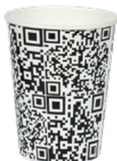
1BG021 BICCHIERI B25 CODICE Q.R. capacità capacity 250cc / 8oz tacca filling line 0,20 pz/conf pcs/ pack 100 pz/cart pcs/box 2000