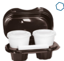
ICAN90 KAFFEBOX CONTENITORE+COPERCHIO PORTA 2 CAFFÈ pz/conf pcs/pack 55 pz/cart pcs/box 550