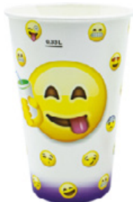
1BG029 BICCHIERI B42 VIOLET capacità capacity 420cc / 12oz tacca filling line 0,33 pz/conf pcs/pack 100 pz/cart pcs/box 2000