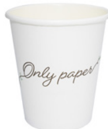
1BG311 BICCHIERI HOT DRINK BOP20 capacità capacity 200cc / 7oz pz/conf pcs/pack 50 pz/cart pcs/box 2000