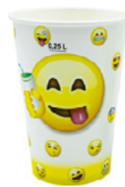
1BG022 BICCHIERI B30 YELLOW capacità capacity 300cc tacca filling line 0,25 pz/conf pcs/pack 100 pz/cart pcs/box 2000