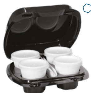
ICAN93 KAPPUCCIOBOX CONTENITORE+COPERCHIO PORTA 4 CAPPUCCINI pz/conf pcs/pack 45 pz/cart pcs/box 180