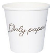
1BG305 BICCHIERI CAFFÈ BOP10 capacità capacity 120cc / 4oz pz/conf pcs/pack 50 pz/cart pcs/box 2000